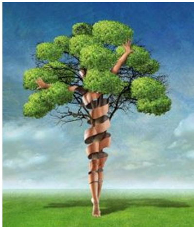
Art– Igor Morski

Tutte le emozioni sono collegate a pensieri, impulsi e sensazioni interne e viceversa.